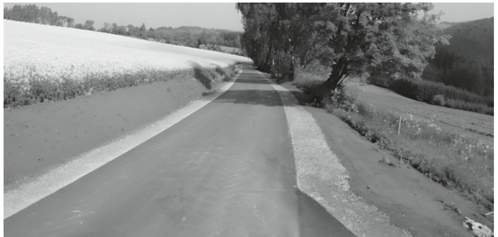
Leichenweg nördlicher Abschnitt

Die Umsetzung der 1,07 km langen Wegebaumaßnahme „Leichenweg nördlicher Abschnitt“ erfolgte von September 2020 bis Juli 2021. Die Baukosten betragen ca. 540 Tsd. EUR. 2022 wurde der „Leichenweg mittlerer Abschnitt“ ausgeführt.