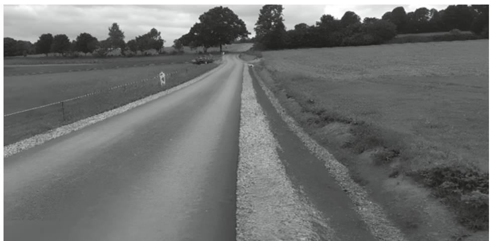
Leichenweg mittlerer Abschnitt