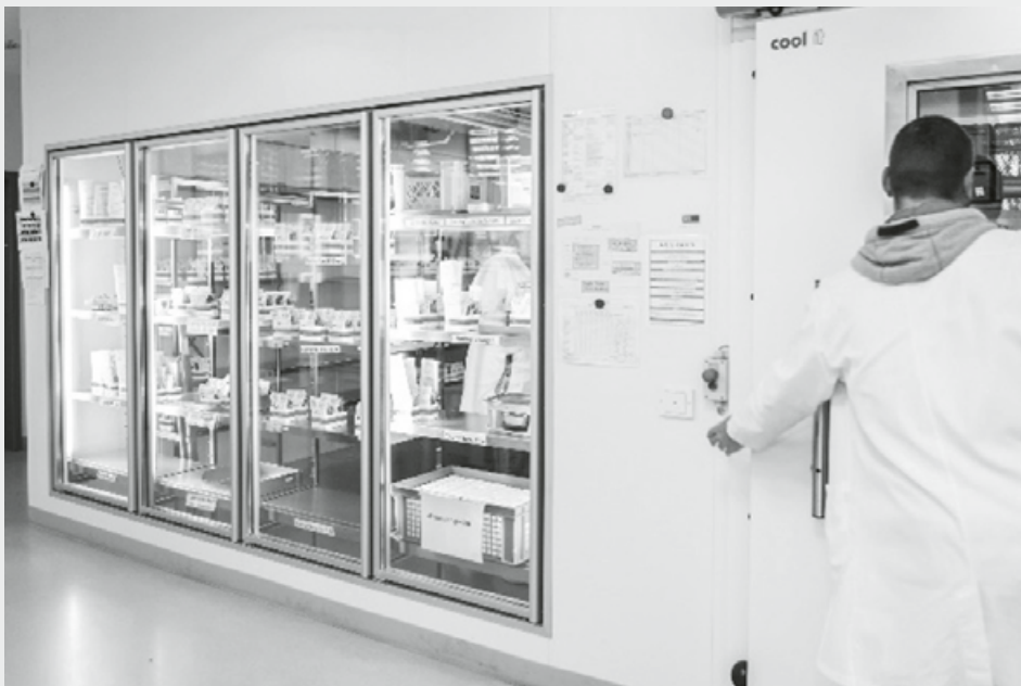
Die Depots des DRK-Blutspendedienstes Nord-Ost müssen auch im Sommer ausreichend gefüllt sein, um die lückenlose Patientenversorgung sicherzustellen

Bitte informieren Sie sich tagaktuell unter www.blutspende-nordost.de/blutspendetermine