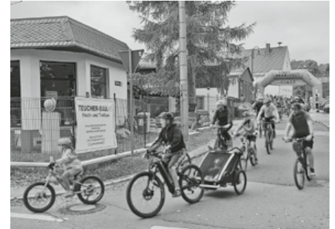
Start in Königswalde am Sportplatz

Am Start waren Touren- und Trekkingräder sowie Mountainbikes. Rechnung getragen