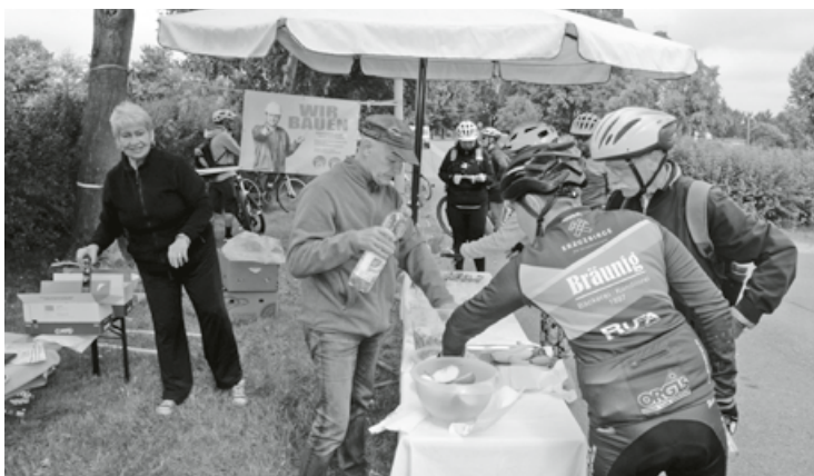
Verpflegungsstelle für die Radler

Die nächste Veranstaltung „Annaberger-Landring-Radeln“ wird im Jahr 2027 stattfinden. Ausrichter wird mit Sicherheit eine der 13 Gemeinden sein, die zum Regionalverbund Annaberger Land gehören.