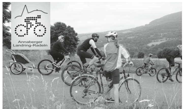
Aussichtreiches Radeln auf der Familientour